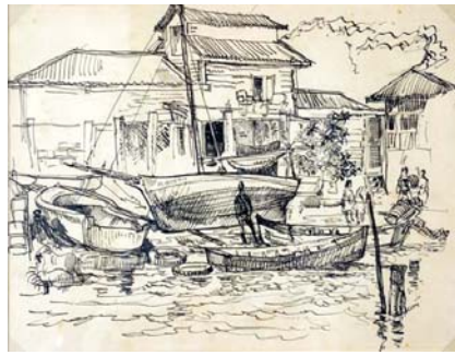
SOBREPASA LAS EXPECTATIVAS "NUESTRA OBRA". Más... [+]